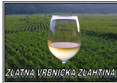
ZLATNA VRBNIČKA ŽLAHTINA

CIJENA UKLJUČUJE: vožnju turističkim brodom, degustaciju domaće rakije na brodu, degustaciju dvije vrste vina u PZ Vrbnik, ručak u konobi „Vrbnička Žlahtina“.